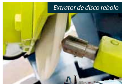
Extrator de disco rebolo