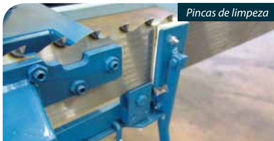
Pincas de limpeza