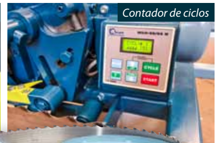
Contador de ciclos