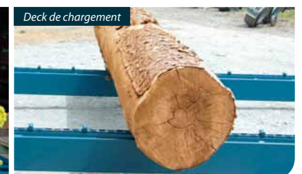
Deck de chargement