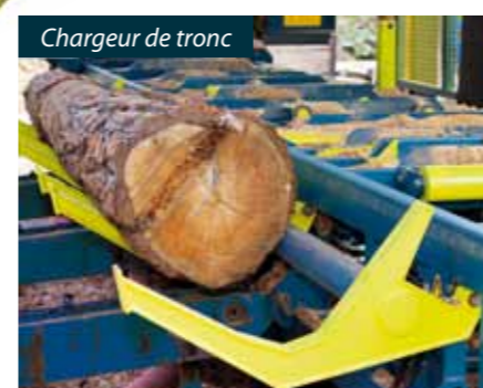
Chargeur de tronc