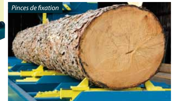
Pinces de fixation