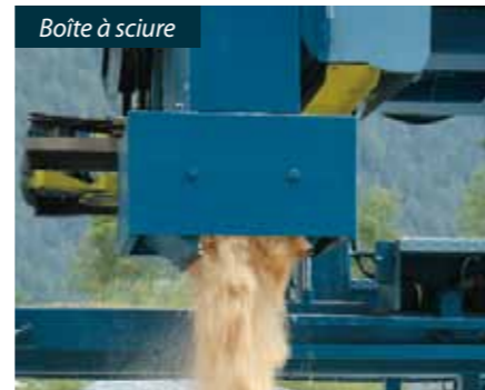
Boîte à sciure

Chargeur de tronc: Le chargeur de tronc hydraulique dépose le bois sur la scie, permettant ainsi de débiter le sciage.