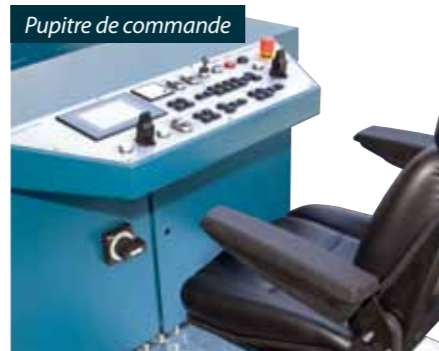
Pupitre de commande