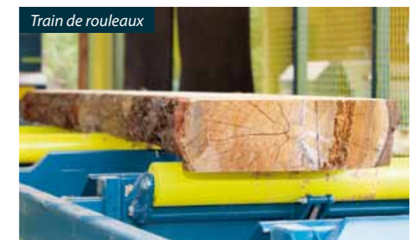
Train de rouleaux