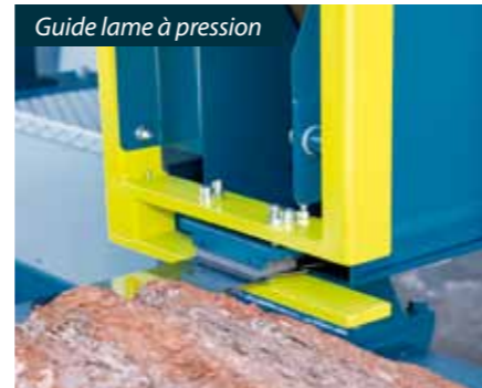
Guide lame à pression