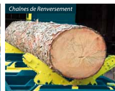
Chaînes de Renversement