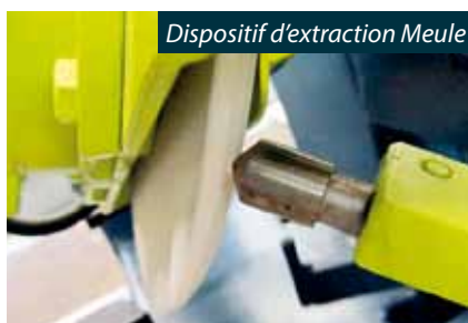
Dispositif d'extraction Meule