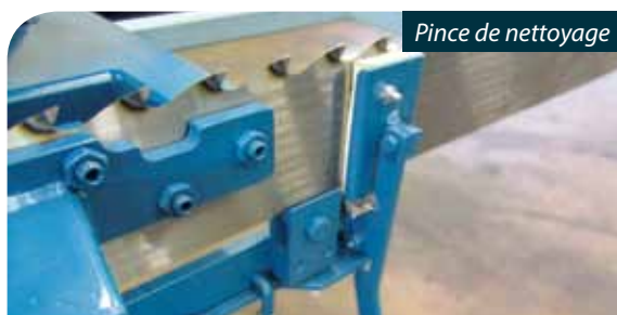
Pince de nettoyage