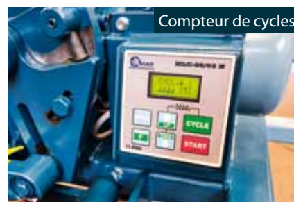
Compteur de cycles