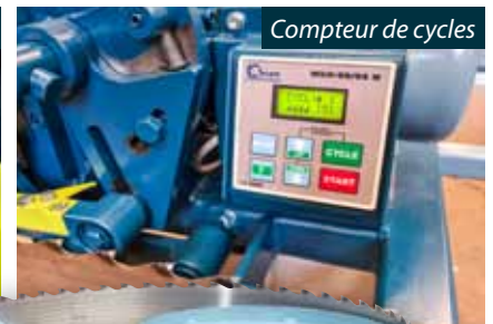
Compteur de cycles