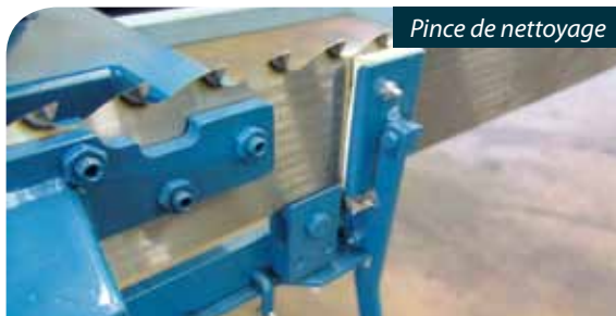
Pince de nettoyage