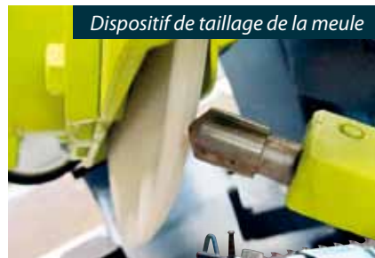
Dispositif de taillage de la meule