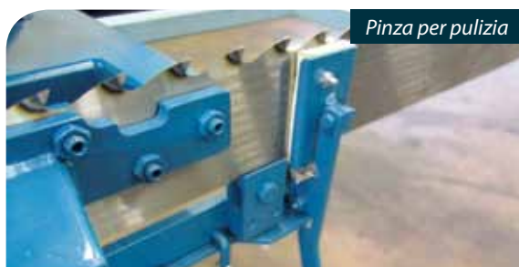
Pinza per pulizia