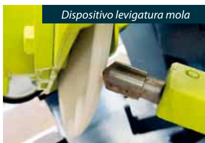
Dispositivo levigatura mola