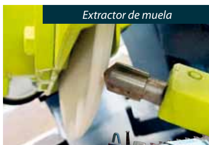
Extractor de muela