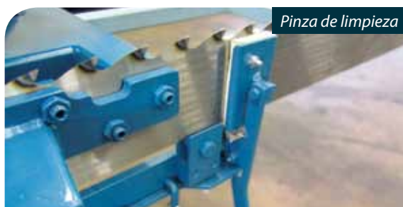
Pinza de limpieza