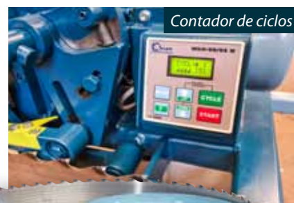
Contador de ciclos